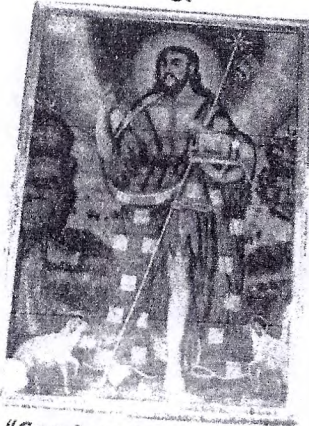
"San Juan Bautista"