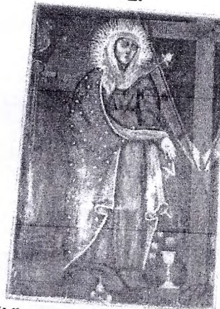
"Virgen de los Dolores"