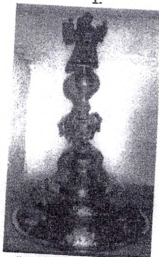
"Pie de Custodia"