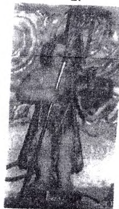
"San Juan Bautista Niño"