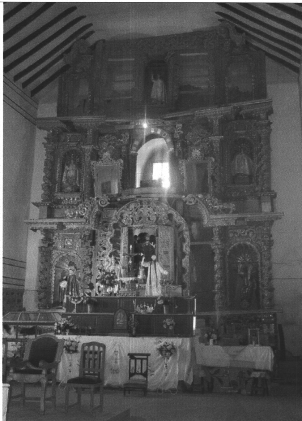
ALTAR MAYOR COMPLETO MUESTRA LOS FALTANTES DE LAS COLUMNAS SALOMONICAS EN LA CALLE LATERAL IZQUIERDA PRIMER CUERPO