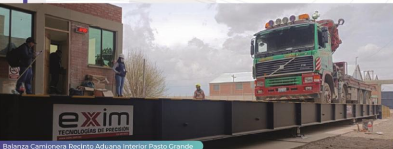
Balanza Camionera Recinto Aduana Interior Pasto Grande