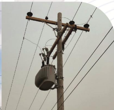
Instalación y Puesta en Marcha de Transformador Trifásico para El Punto de Inspección Aduanero Porvenir.