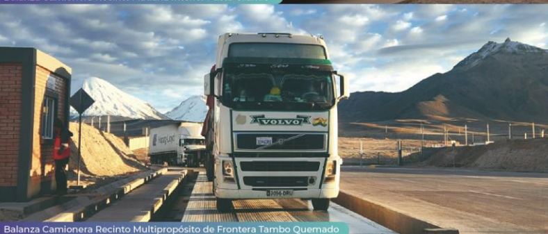
Balanza Camionera Recinto Multipropósito de Frontera Tambo Quemado