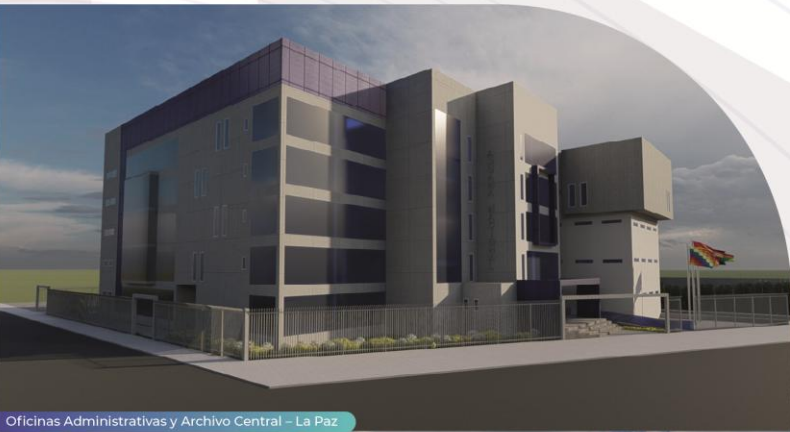
Oficinas Administrativas y Archivo Central – La Paz

Estos proyectos permiten ahorrar en alquileres, ampliar patrimonio institucional y mejorar la atención al público.