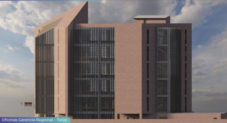
Oficinas Gerencia Regional – Tarija