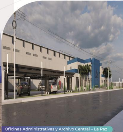
Oficinas Administrativas y Archivo Central - La Paz