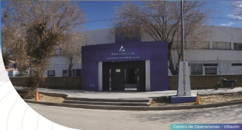
Centro de Operaciones – Villazón