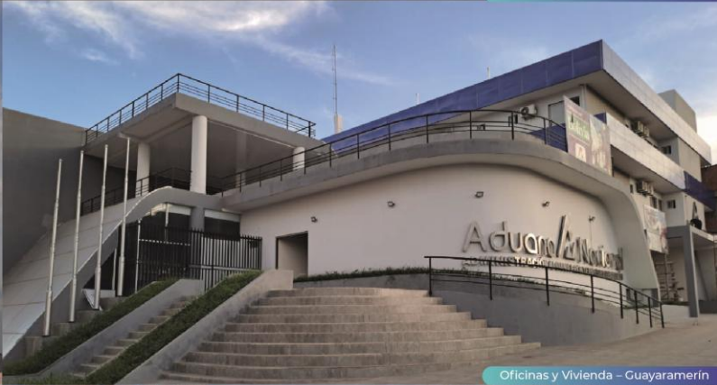
Oficinas y Vivienda – Guayaramerín