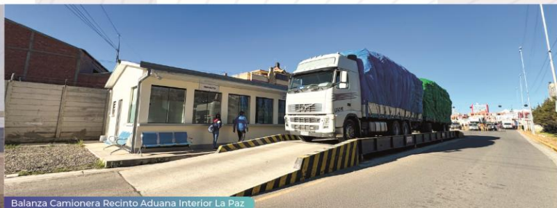
Balanza Camionera Recinto Aduana Interior La Paz