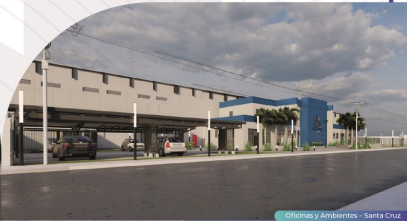
Oficinas y Ambientes – Santa Cruz