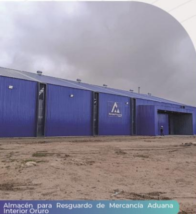
Almacén para Resguardo de Mercancía Aduana Interior Oruro

Con Bs 16,4 millones, se implementaron oficinas y almacenes modulares en Oruro, La Paz, Santa Cruz y Viru Viru. Además, se centralizó el resguardo de archivos y activos, optimizando el uso del espacio y recursos.