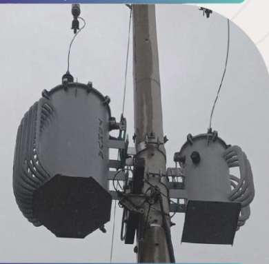
Instalación y Puesta en Marcha de Transformador Trifásico para la Administración De Aduana Frontera Bermejo.