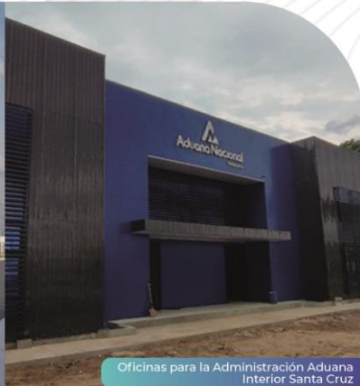
Oficinas para la Administración Aduana Interior Santa Cruz