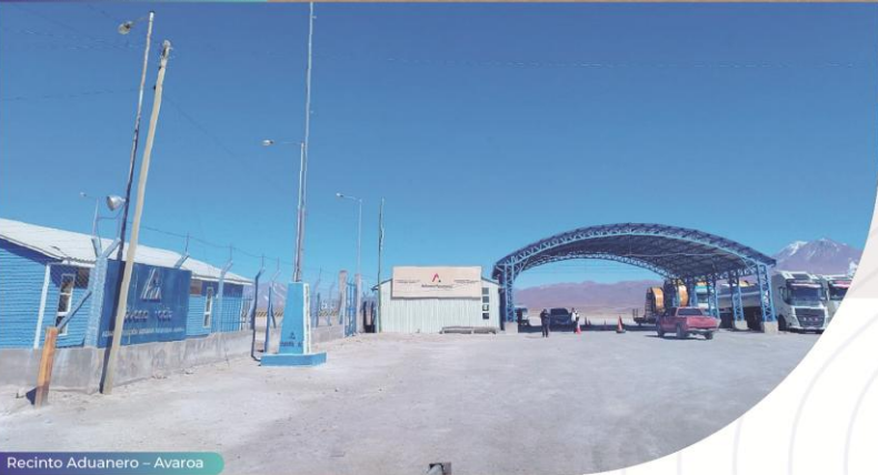
Recinto Aduanero – Avaroa