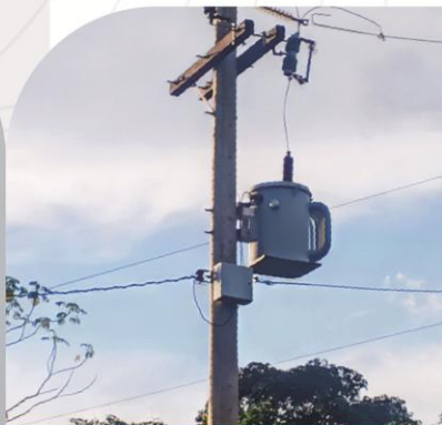
Instalación y Puesta en Marcha de Transformador Eléctrico para El Punto de Inspección Aduanero Yata.