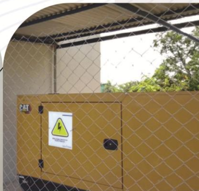
Instalación y Puesta en Marcha de Transformador Trifásico para Administración de Aduana Aeropuerto Viru Viru.