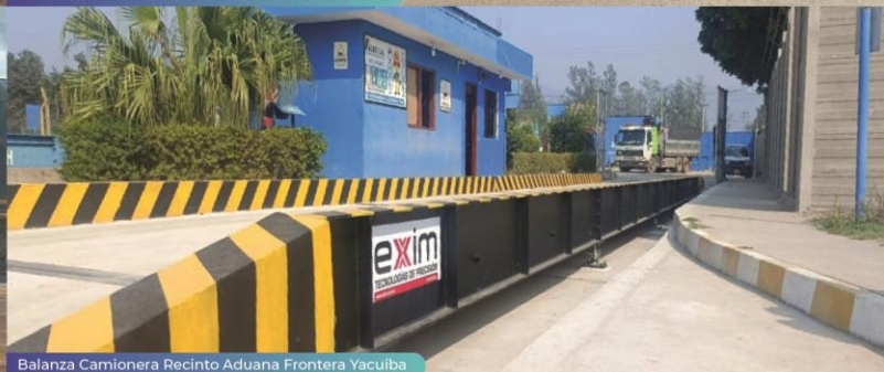
Balanza Camionera Recinto Aduana Frontera Yacuiba