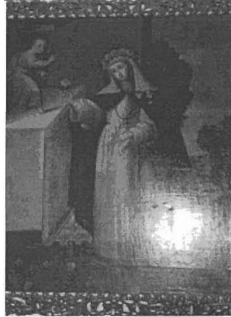
Tema: Desposorio Místico de Santa Rosa de Lima Técnica: Óleo sobre lienzo Época: Siglo XVIII Dimensión: largo 150 cms. x ancho 120 cms.