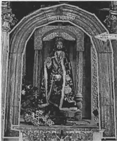
Título: "Arco Peraltado de San Luis" Autor: Anónimo Técnica: Repujada / Plata