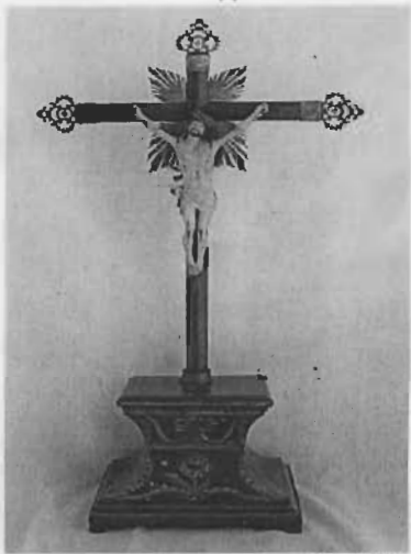
Título: "Cristo Crucificado" Autor: Anónimo Técnica: Pasta / Tallada / Maguey Dim: 40 x 30 cms.