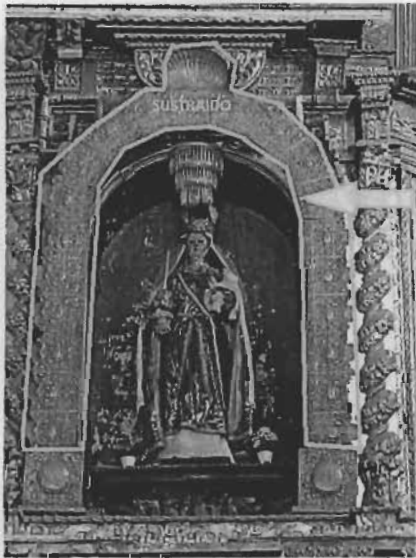
Título: "Arco de la Virgen de la Candelaria" Autor: Anónimo Técnica: Repujada / Plata