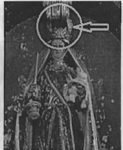
Título: "Corona de la Virgen de la Candelaria" Autor: Anónimo Técnica: Repujada / Plata