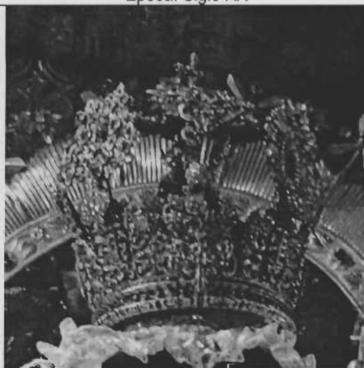
Tema: Corona de la Virgen de Copacabana Técnica: Plata, piedras/calada, dorada Niño Jesús Dimensión: Alto 28 cms. x diámetro 22 cms. Época: Siglo XIX Peso: 7 libras