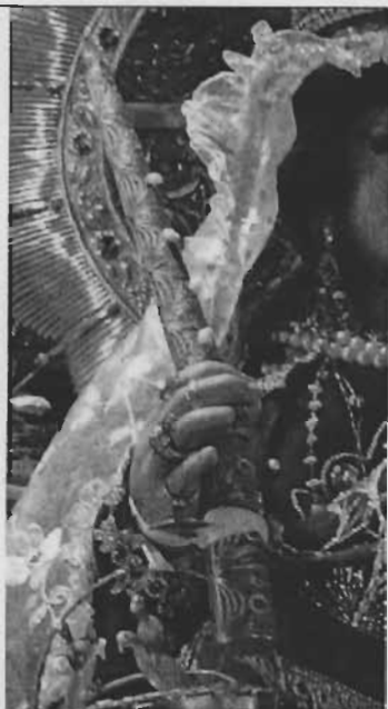
Tema: Cirio Técnica: Plata/dorada, filigrana Dimensión: Alto 30 x diámetro 0,4 cm Época: Siglo XX