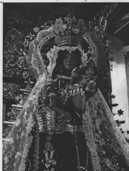
Tema: Resplandor de la Virgen de Copacabana Técnica: Plata, piedras/laminada, dorada Dimensiones: Largo 120 x alto 95 cms. Época: Siglo XIX