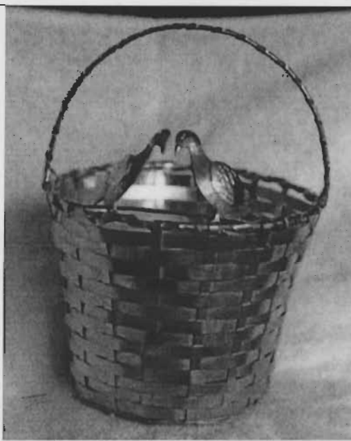
Tema: Canasta con cuatro palomas Técnica: Plata/laminada, dorada Dimensión: Alto 12 x diámetro 12 cm Época: Siglo XX