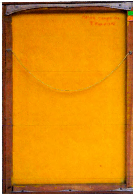
Vista posterior del soporte