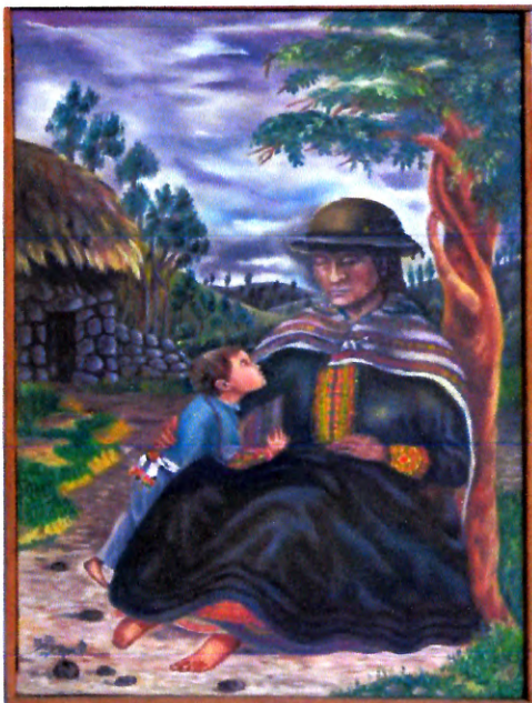
Madre campesina Tito Manrique Fecha: 1979 Dim: 64.5 x 43.5 cms.