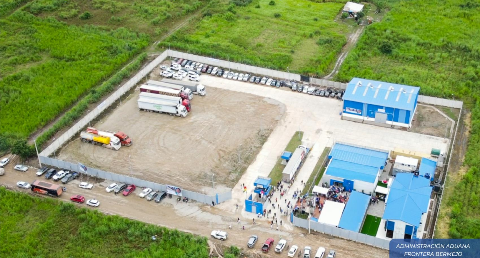
ADMINISTRACIÓN ADUANA FRONTERA BERMEJO

Mejores condiciones para operadores de comercio y servidores públicos