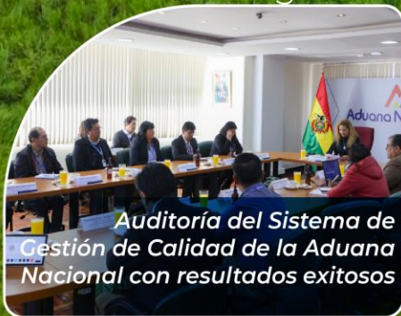
Auditoría del Sistema de Gestión de Calidad de la Aduana Nacional con resultados exitosos