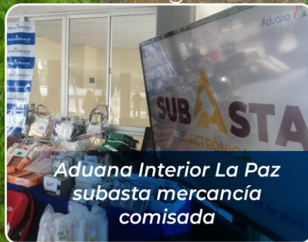
Aduana Interior La Paz subasta mercancía comisada