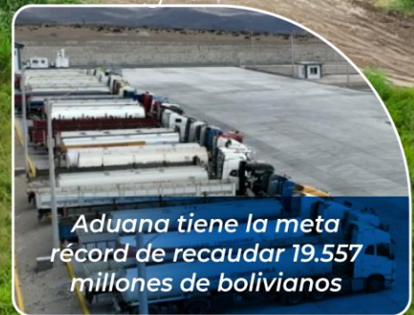
Aduana tiene la meta récord de recaudar 19.557 millones de bolivianos