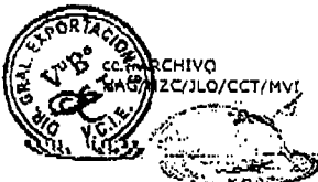
Lic. Hunsca Ajoa Cuerrero VICEMINISTRO DE COMERCIO INTERNO Y EXPORTACIONES Ministerio de Desarrollo Productivo y Economía Plural

Sin otro particular, saludo a usted con las consideraciones más distinguidas.