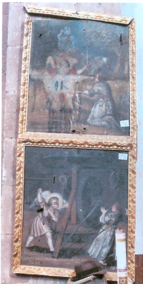
Estado original de la obra antes del robo

Las piezas sustraídas no pueden ser exportadas ni comercializadas de acuerdo al Artículo 191 de la Constitución política del estado y Decreto Supremo 05918 en sus artículos 3 y 22 del 6 de noviembre de 1961.