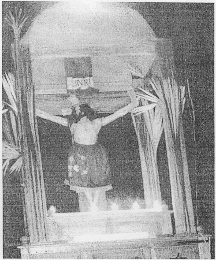
SEÑOR DE LA AGONIA