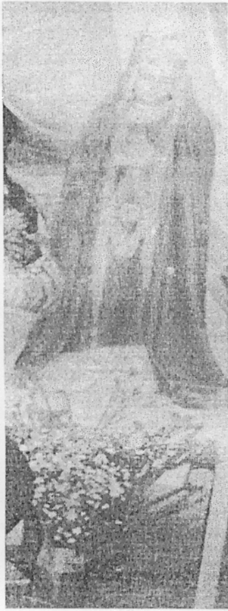
VIRGEN DEL ROSARIO