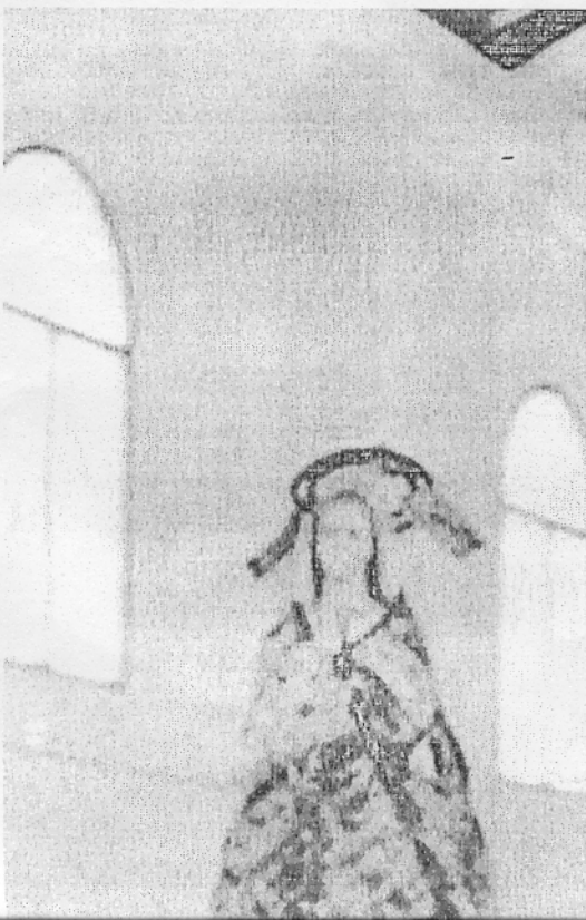
VIRGEN DE FATIMA